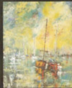
"Merise Verte" H.S.T. 81 X 65 cm

Estimation moyenne à la vente > 100 € le point