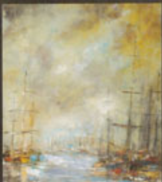
"Vieux Gréements" H.S.T. 100 X 81 cm