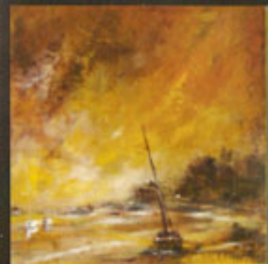
"Marine Orangée" H.S.T. 80 X 80 cm