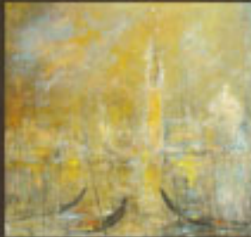
"Venise Nocturne" H.S.T. 80 X 80 cm