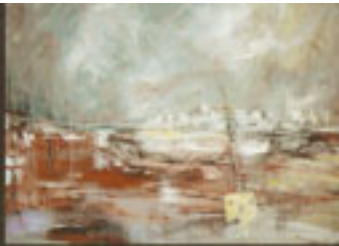
"Marine Rose" H.S.T. 100 X 80 cm