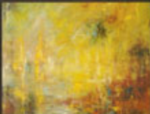
"Lumières et reflets" H.S.T. 81 X 61 cm

Directeur libre et altier, ferrailleur un peu forçant, pourfendeur de ses propres contradictions, fougueux et cœur sensible, il est de la race d'Atlas.