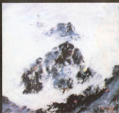
"Pointe du Roc" H.S.T. 100 X 100 cm

Estimation moyenne à la vente > 100 € le point